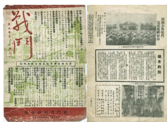
图 54. 《战斗》月刊 1955 年 5 卷 3-4 期逝世特刊