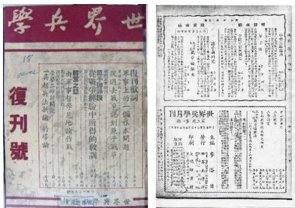
图 48. 《世界兵学》1946 年 5 月 3 卷 1 期复刊号