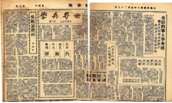
图 55. 4月29日《世界兵学》专栏第三期