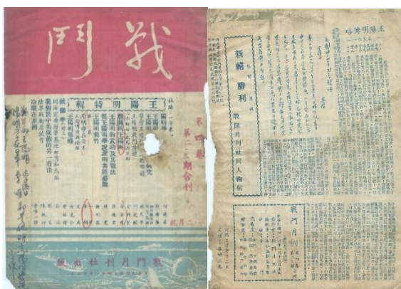
图 53. 《战斗》月刊 1955 年 1 月 4 卷 2-3 期