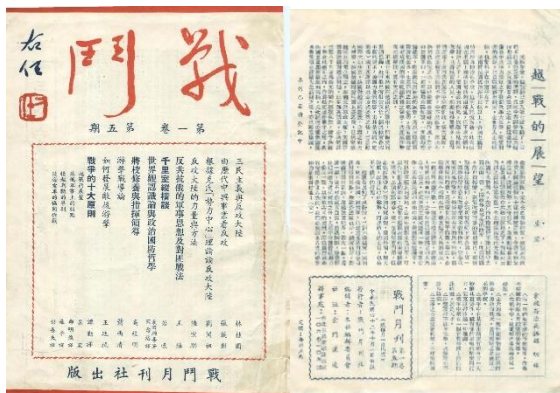
图 51. 《战斗》月刊 1953 年 10 月 1 卷 5 期首刊

谈会]的专文 14 篇；1954 年共发行十二期：其中 2 卷 5 期（图 52）有[孙子兵法特辑]专文 17 篇；1955 年共发行九期七刊：其中 4 卷 2-3 期合刊（图 53）有[王阳明特辑]专文 14 篇，4 卷 4 期有[王阳明特辑]专文 4 篇，逝世后 9 月的 5 卷 3-4 期合刊（图 54）有[李浴日先生纪念特辑]专文 25 篇。本刊由于右任院长题封，「金门战斗月刊社」发行，社址为金门溪边，办事处设在台北市罗斯福路三段 106 巷 104 号，1954 年 10 月后办事处地址改在台北中和乡竹林路三巷内。