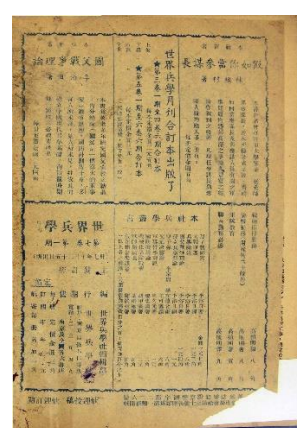
图 49. 《世界兵学》1947 年 9 月 5 卷 1 期六周年纪年特刊 图 50. 《世界兵学》1948 年 10 月 7 卷 1 期末刊