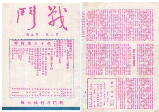
图 52. 《战斗》月刊 1954 年 4 月 2 卷 5 期