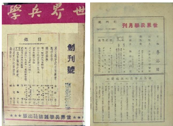
图 47. 《世界兵学》1941 年 8 月创刊号