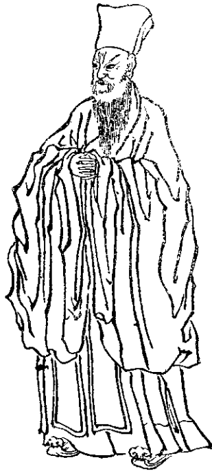
吾雖不學，而為其學之精神，一心得其者。 陽明先生像